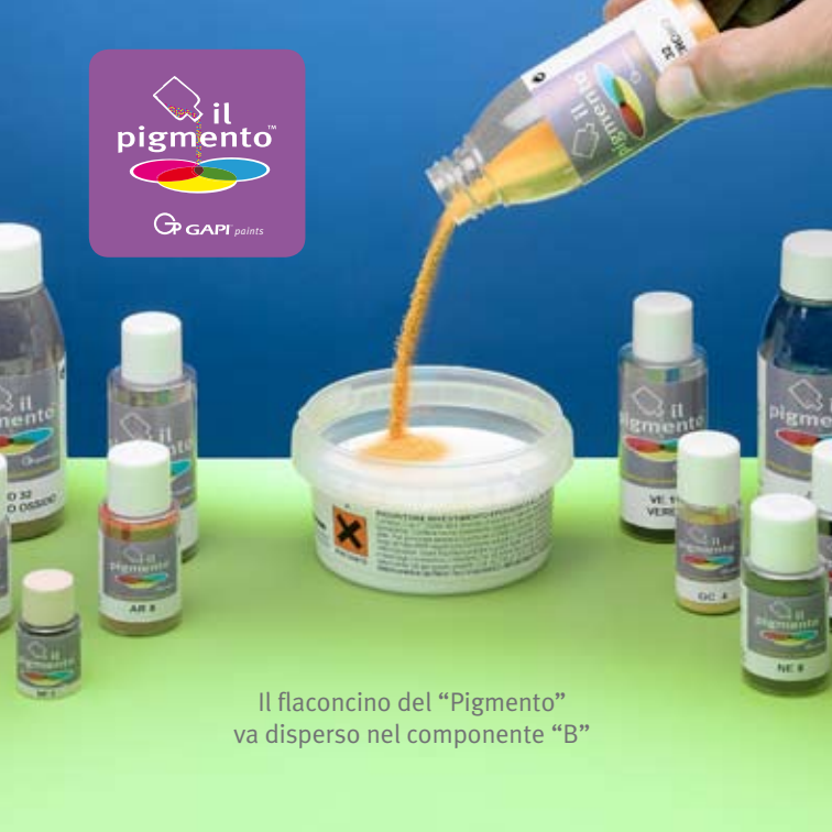
Il flaconcino del “Pigmento” va disperso nel componente “B”